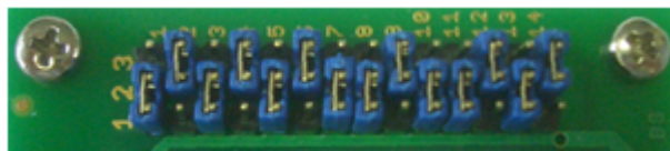
Pos. 1 ( MB96F336Y/MB96F338Y )