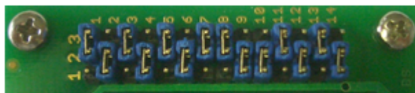
Pos. 3 ( MB96F378/MB96F379 )