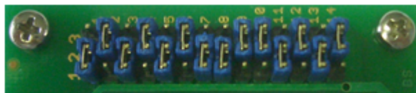
Pos. 2 ( MB96F336U/MB96F338U )