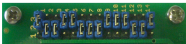
Pos. 2 ( MB96F336U/MB96F338U )