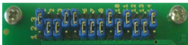
Pos. 1 ( MB96F336Y/MB96F338Y )