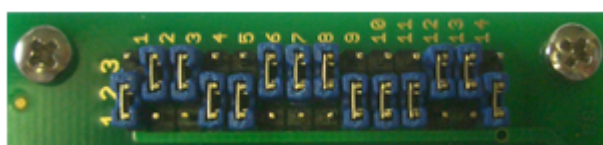
Pos. 3 ( MB96F378/MB96F379 )